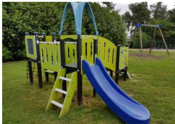
Uitbreiding speelplein Watemy voor de allerkleinsten