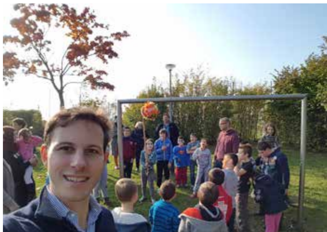
Nieuw speelplein Dierdonk